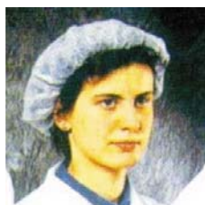
Figura 2. Esempio di cuffia monouso

Per quanto riguarda i DPI più semplici, come le cuffie (Figura 2), sono dei copricapo destinati ad avvolgere i capelli sia per motivi igienici che di sicurezza, proteggendoli da contatti accidentali con macchinari. Le cuffie per essere idonee devono rispettare alcune caratteristiche essenziali come avere dimensioni adeguate per contenere la maggior parte dei capelli, essere leggere, lavabili (o monouso), facilmente indossabili e avere caratteristiche estetiche adeguate tali da renderle accettabili dall'operatore.