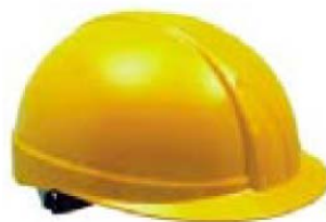
Figura 4. Esempio di copricapo antiurto per industria Peso: 250 gr Calotta in polietilene

Le norme tecniche forniscono direttive anche sul tipo di marcatura che deve essere impressa sul DPI stesso (marcatura CE, marchio del fabbricante, tipo di elmetto, numero della norma di riferimento, data di fabbricazione e taglia) e sulle informazioni supplementari che devono accompagnarlo: norme sul corretto utilizzo, stoccaggio, pulizia, durata e manutenzione. Per quanto riguarda il copricapo antiurto deve essere applicata un'etichetta durevole sul DPI che rechi la seguente scritta: "AVVERTENZA! QUESTO NON È UN ELMETTO DI PROTEZIONE PER INDUSTRIA; non protegge dagli effetti della caduta o del lancio di oggetti né di carichi sospesi o in movimento. Non deve essere utilizzato al posto di un elmetto di protezione per industria".