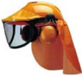
Figura 6. Esempio di DPI per boscaioli

Elmetto (peso netto 315 gr), cuffia, visiera in acciaio inox, mantellina parapioggia