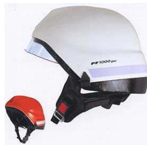
Figura 7. Esempio di elmetto per vigili del fuoco

Per quanto riguarda i requisiti prestazionali questi sono equiparabili ai precedenti elmetti con in più una caratteristica peculiare che è quella della resistenza al calore radiante : l'elmetto per essere conforme alla norma deve sottostare ad una specifica prova di resistenza al calore in modo che nessuna parte dell'elmo fonda al punto da provocare gocciolamento del materiale e che nessun danno o deformazione provocata dal calore ne comprometta la resistenza durante la prova d'urto.