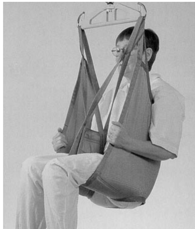
Figura 3. Esempio di imbracatura con supporto sino alla regione medio-dorsale

L' imbracatura (fig. 3) deve essere scelta considerando la disabilità e le dimensioni corporee del paziente, nonché il tipo di trasferimento da effettuare (letto-carrozzina, letto-wc, ecc.). Alcune imbracature sono dotate di poggiatesta, di stecche rigide di sostegno e di imbottiture (queste ultime per evitare la presenza di elevate pressioni localizzate sul paziente, in particolare a livello di cosce e cavo popliteo) (4).