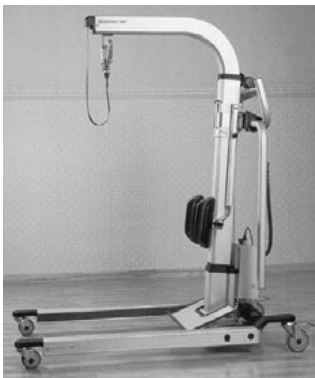
Figura 1. Modello di sollevatore di tipo mobile

In ambito ospedaliero, le operazioni più difficoltose di movimentazione manuale di pazienti (trasferimento letto-carrozzina, letto-barella, sollevamento da terra, ecc.) si giovano spesso dell'uso di sollevatori di tipo mobile (fig. 1). Purtroppo, la letteratura propone pochi studi relativi alle caratteristiche ideali, di tipo strutturale e funzionale, di cui dovrebbero essere dotati questi sollevatori (1, 3).