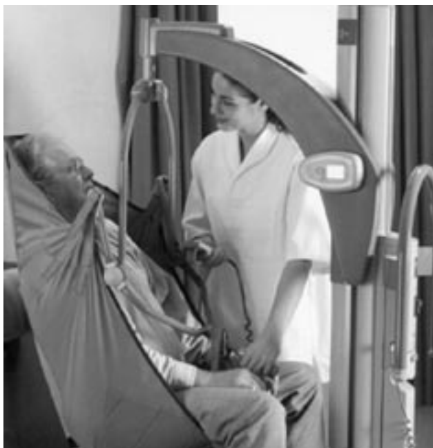
Figura 4. Barre basculanti manovrabili con un timone

Ogni imbracatura deve essere contrassegnata in modo chiaro per facilitare al bisogno la rapida selezione dei diversi modelli e taglie. Inoltre, va sempre curata una puntuale esecuzione della sequenza di operazioni di posizionamento delle diverse imbracature, quale viene descritta nelle istruzioni per l'uso delle stesse.